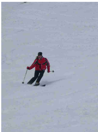
Christian bei der Abfahrt