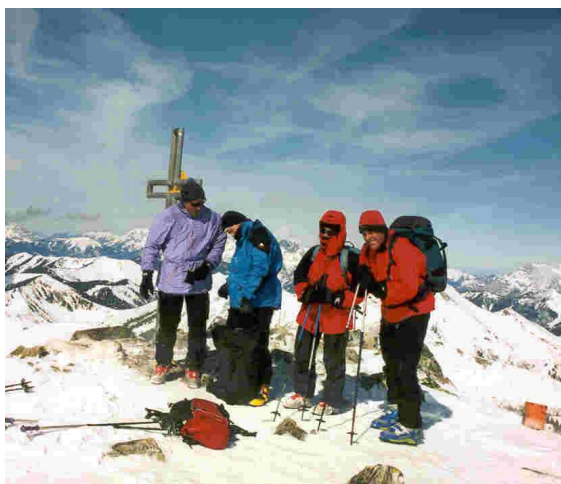
Am Gipfel des „K3“ bei eiskaltem, stürmischem Wind

Gebirgsgruppe: TRIEBENER TAUERN / Triebental