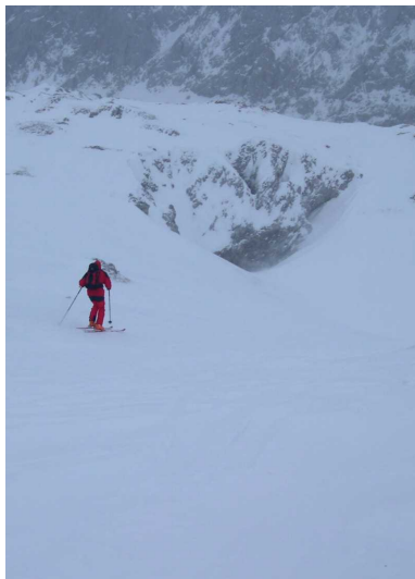
Abfahrt vom Rotgangkogel