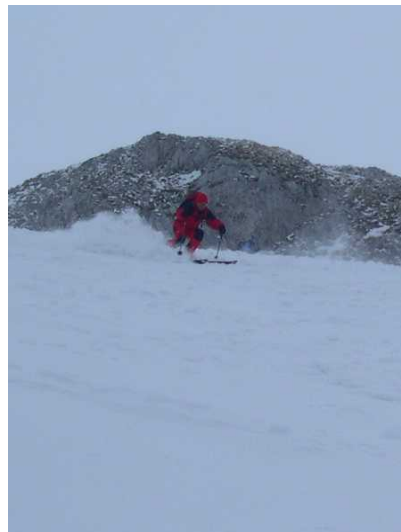
Abfahrt über das Schwabenkar (Meran Steig)