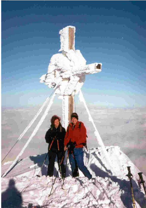
Über der Nebeldecke auf dem Gipfel