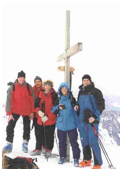
Auf dem Gipfel des Gamsfeld (2.027m)