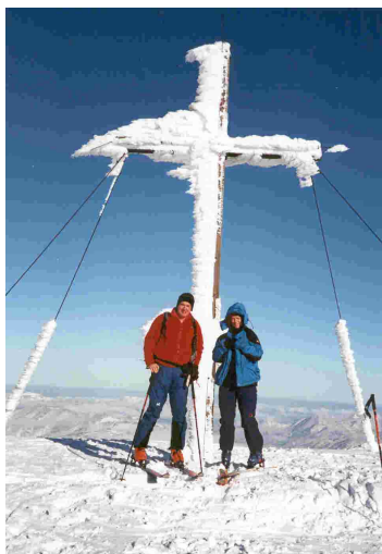
Am Gipfel des Göller (1.766m)