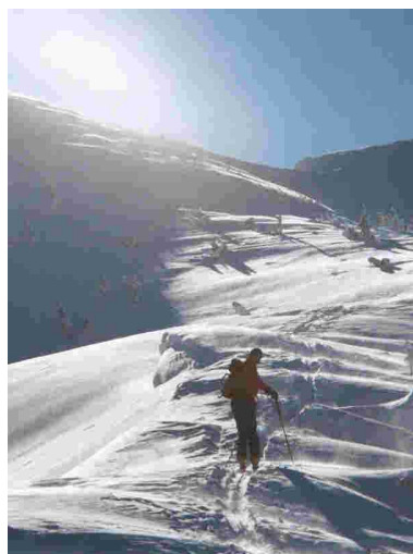
Beim Aufstieg über den Nordkamm (Gsenger)