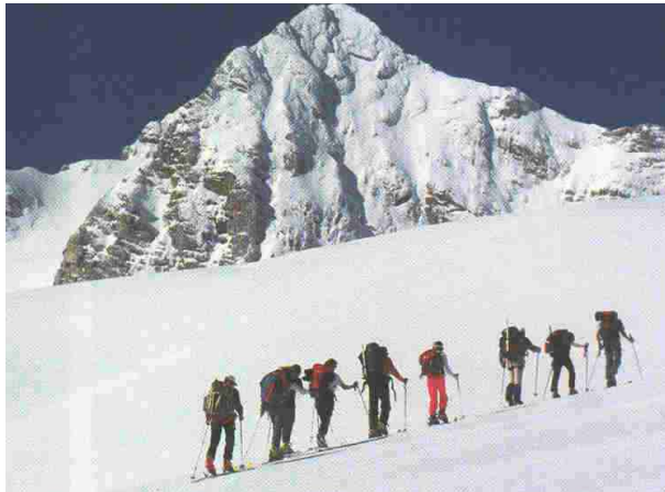
Aufstieg zur Dachsteinwarte (im Hintergrund der Dachstein – 2.998m)

Gebirgsgruppe: DACHSTEINGRUPPE / ST / OÖ