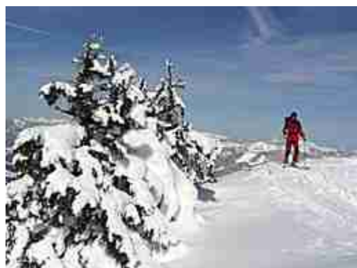
Die letzten Meter vor dem Gipfel