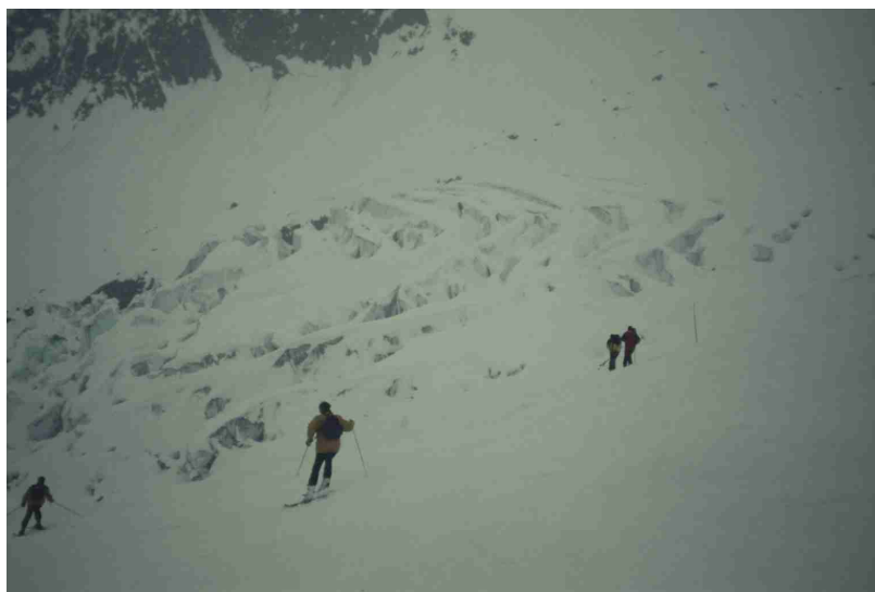
Abfahrt durch das Glacier d' Argentiere (rechts im Bild Werner „Fichtl“ und Manfred)